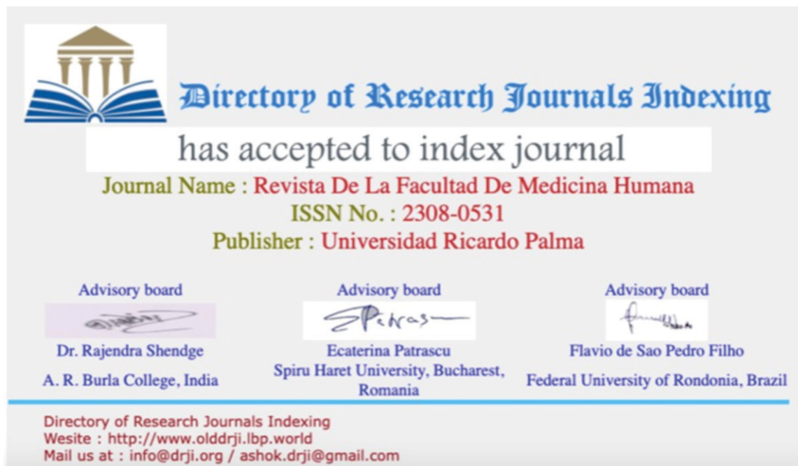
Figura 2. Reconocimiento dado por Directory of Research Journals Indexing a la Revista de la Facultad de Medicina Humana de la Universidad Ricardo Palma por su aceptación como revista indexada.

Adicionalmente, es satisfactorio enfatizar que la RFMH ha sido indexada en la base de datos EMBASE desde 2020. EMBASE es una herramienta de gran prestigio y altamente valorada por académicos e investigadores, ya que se especializa en el campo biomédico y es utilizada para acceder a niveles más altos de evidencia científica en revisiones sistemáticas y metanálisis. Al estar en EMBASE, la RFMH se posiciona en una plataforma que facilita la búsqueda de literatura científica de alta calidad, y permite que los investigadores accedan a sus publicaciones con mayor facilidad cuando realizan investigaciones exhaustivas y buscan fuentes de evidencia confiables. Esto también significa que los estudios publicados en la RFMH pueden ser citados con mayor frecuencia, aumentando su impacto en la comunidad científica. Es crucial destacar que al formar parte de EMBASE, la RFMH se